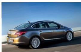
Opel Astra four-door/Viertürer