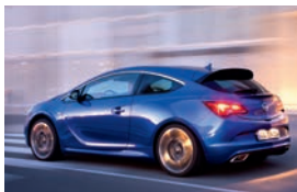
Opel GTC OPC