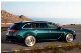
Opel Insignia Sports Tourer