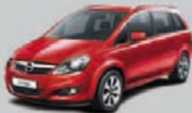
▲ Czerwony Power 1