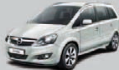
▲ Zielony Spirit