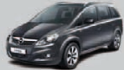
▲ Szary Technical