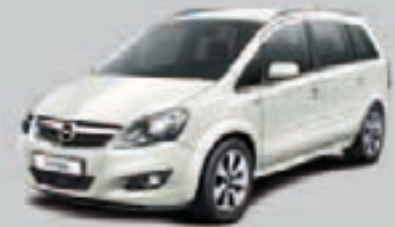
▲ Biały Olympic