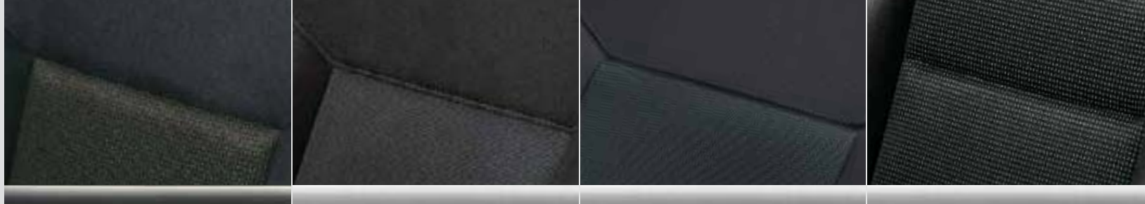
▲ Alpha/Elba Czarny. Elementy dekoracyjne: Czarny.