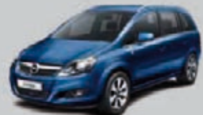
▲ Niebieski Ultra