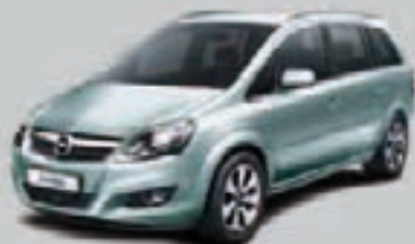
▲ Błękitny Ice Berg