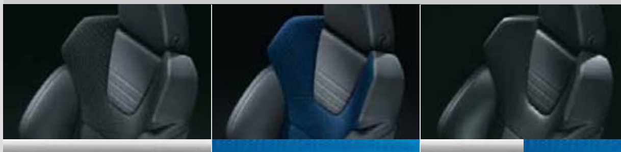
▲ Fotel Recaro. Race Srebrny/skóra 2 Czarny. Elementy dekoracyjne: Matt Chrome.