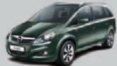
▲ Zielony Myth