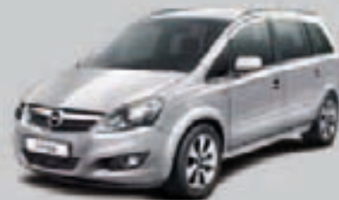
▲ Srebrny Sovereign