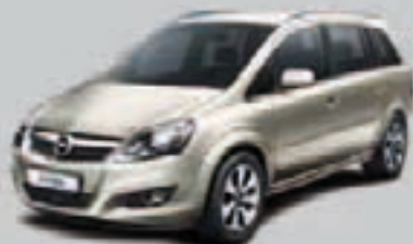
▲ Jasnoszary Pannacotta