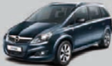
▲ Ciemnoszary Metro