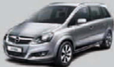
▲ Srebrny Lightning 1