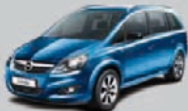
▲ Błękitny Arden 1