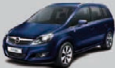
▲ Granatowy Royal