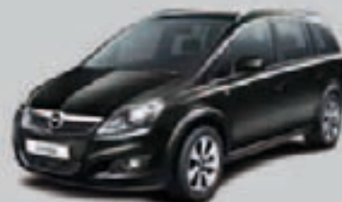
▲ Czarny Sapphire 1