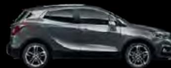
Szary Satin Steel 1