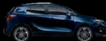
Niebieski Darkmoon 1