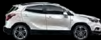
Biały Abalone 1