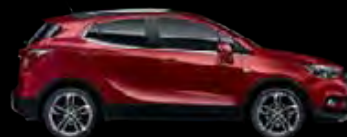
Czerwony Velvet 1,2