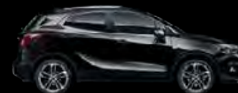
Czarny Mineral 1