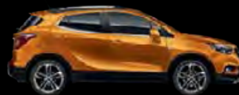
Pomarańczowy Amber 1

Skonfiguruj swoją Mokkę X na www.opel.pl/mokka-x .