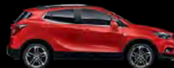
Czerwony Absolute 1