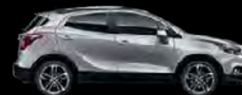
Srebrny Sovereign 1